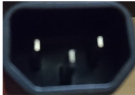
オス・コネクタ (非防水)