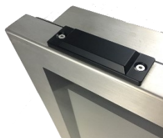
フラットタイプの無線 LAN アンテナ