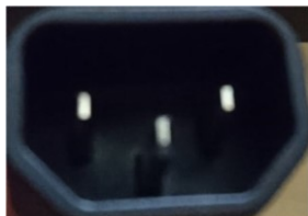
オス・コネクタ (非防水)