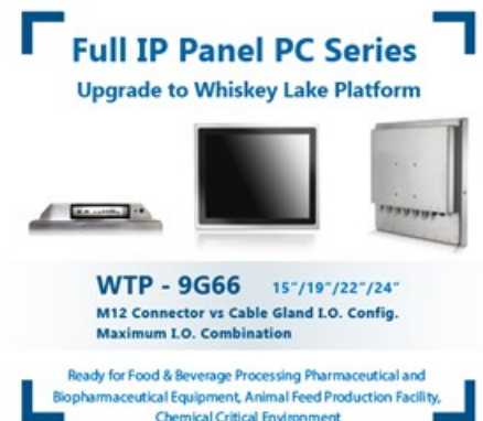
図 1. WTP-9G66 シリーズ; 15 型、19 型、21.5/24 型フル HD 版