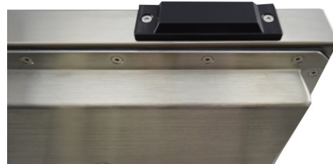
図 2. IP69 対応とフラット・タイプのアンテナ

WTP-9G66 シリーズでもステンレス筐体を採用しており、IP66/IP69K に対応しております。IP69K (高温、高水圧、スチームジェット洗浄での水分混入から保護) を実現するために高耐久性の投影型静電容量タッチパネル・オプションと下図のようなフラット・タイプの無線 LAN アンテナを用意しております。(従来の棒型アンテナからフラット・タイプへ全面改訂) また、水産加工業等で塩分の高い環境にてご利用される場合に対応して、ステンレス筐体を『SUS316』へ変更することも可能です。(標準は『SUS304』)