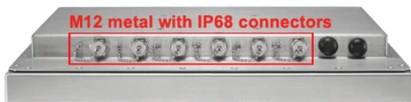
図: M12 メタル・コネクタを用いた IP68 対応の外部 I/O コネクタ写真

WTP-9A66-15/19 では高性能の Core-i CPU を搭載しており、メインメモリは DDR3 2GB(標準)を搭載しております。本体の背面には「M12 メタル・コネクタ」を利用した IP68 対応の外部 I/O コネクタがあり、シリアルポート x 2、USB ポート x 2、LAN ポート x 1 と DC 電源入力コネクタを標準装備しております。(USB ポートはオプションのケーブル利用で1つのコネクタから2ポートに追加することも可能です。)