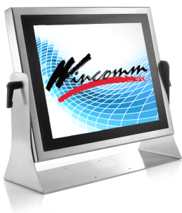
図: WTP-9A66-15/19 の筐体写真

ステンレス筐体のタッチパネル PC シリーズでは、劣悪環境にも耐えられる設計となっておりますが、加えて厳格な試験も実施していることで、安全且つ良好な性能を確保しております。また、ステンレス材料は「強力な水柱」や「強酸、強アルカリ」にも強く、損傷を受けることはない材質です。