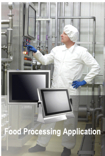
図: WTP-9A66 シリーズの食品加工業での利用例

食品加工業などでは、常に強力な水柱で洗浄する必要があり、自動制御システムでは防水などの対策は重要となります。WTP-9A66 シリーズでは、IP66 防塵・防水に適合しているため、高圧の水柱洗浄にも耐えられ、前面フルフラットのタッチパネル構造を採用していることで、前面に埃が溜まることもない完全な防塵構造となります。