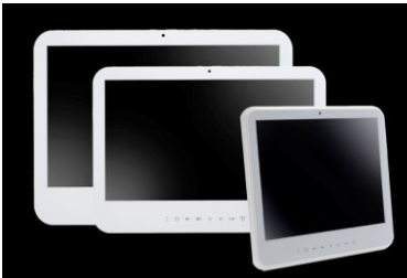
写真: WMP-24F/22F/19F シリーズ

WMP-24F/22F/19F シリーズでは、Intel vPro テクノロジーに対応しており、情報セキュリティの向上と共に、リモート・アクセス手法も強化されております。性能の向上に加え、医療用で要望の多い『フル HD 対応のキャプチャーカード』もカスタマイズ・オプションとして追加可能となっております。