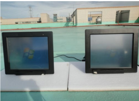
写真: WLP-7D20 シリーズの 15 インチと 19 インチ