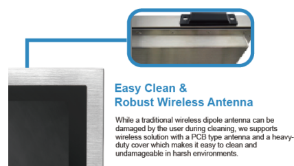
図 1. IP66/IP69K 完全防塵防水筐体・フラットタイプの無線 LAN アンテナ搭載・SUS304/SUS316 ステンレス